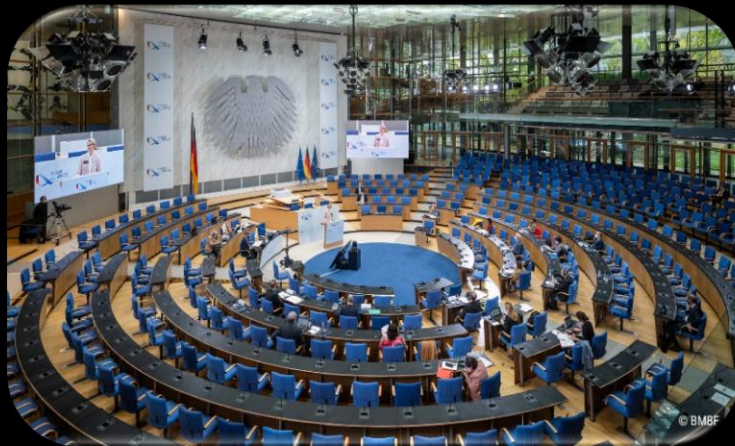
HYBRIDE KONFERENZ EU MINISTERKONFERENZ