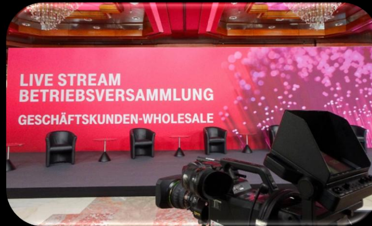
HYBRIDE BETRIEBSVERSAMMLUNG TELEKOM DEUTSCHLAND GMBH